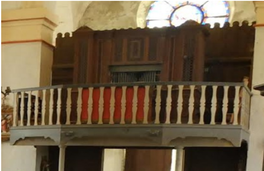
Photographie de l'orgue avant sa dépose en 2012

d'après l'ouvrage LES ORGUES de LORRAINE-VOSGES Association d' Etudes pour la coordination des Activités Régionales Musicales Editions Serpenoise 1991